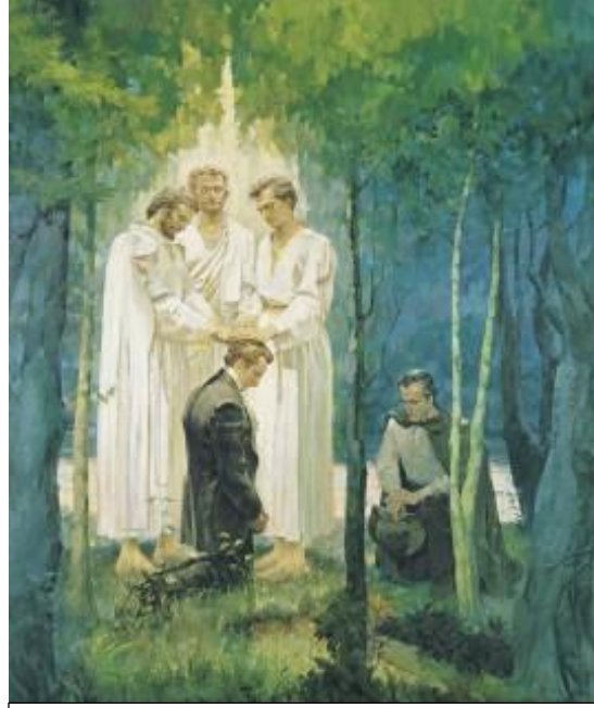
La Restauración del Sacerdicio de Melquisedec , por Del Parson