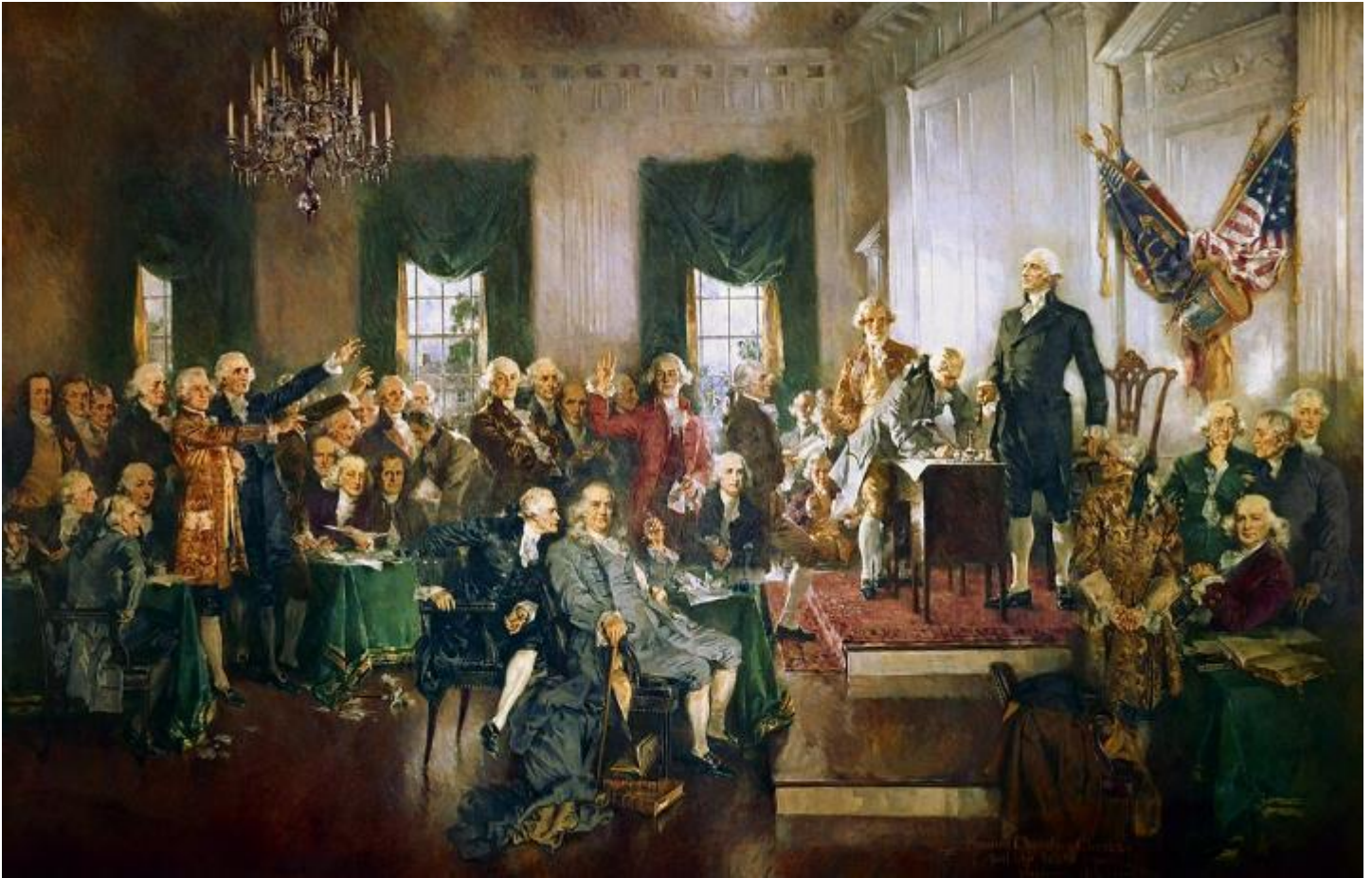
Escena en la firma de la Constitución de los Estados Unidos por Howard Chandler Christy

El presidente Wilford Woodruff declaró que “los hombres que sentaron las bases de este gobierno estadounidense y firmaron la Declaración de Independencia fueron los mejores espíritus que Dios del cielo pudo encontrar sobre la faz de la tierra. Ellos fueron... inspirados por el Señor” ( Informe de Conferencia , abril de 1898, 89).